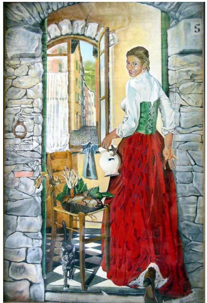
La Bella di Torriglia di Pietro Lumachi - Olio su lino

La cucina locale è quella tipica dell'entroterra ligure, nei ristoranti potrete gustare ravioli, pasta al pesto in vari formati, i secondi piatti sono a base di carne, pollame, coniglio e cacciagione. Tra i dolci, merita menzione il Canestrelletto di Torriglia, biscotto riconosciuto come "Prodotto Agroalimentare Tipico Italiano (P.A.T.)", e la torta detta "Bella di Torriglia".